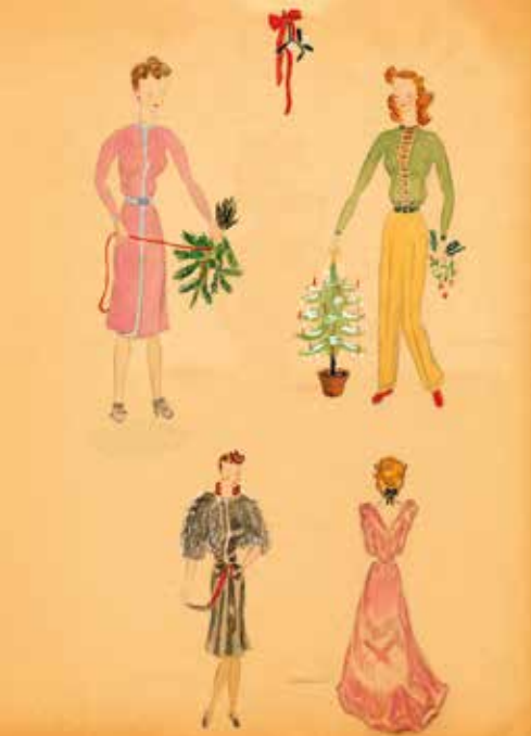
Ținute din copilărie de care Hubert de Givenchy ar fi fost mândru