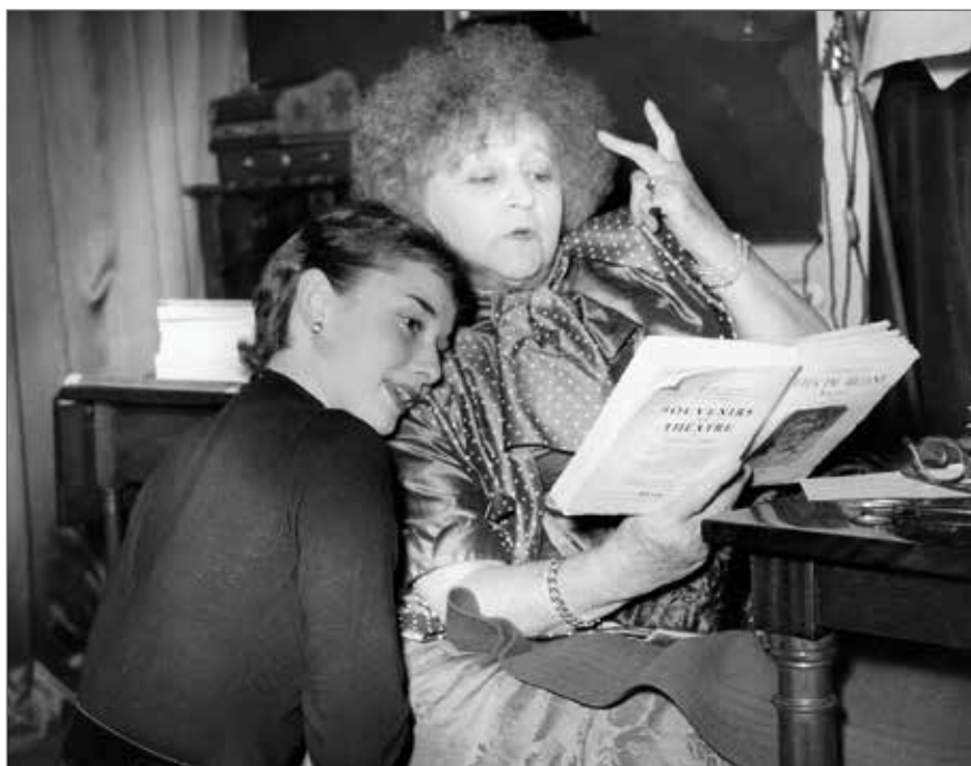
Colette, primul ei talisman