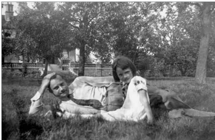
Fotografia preferată cu tatăl ei, înainte ca acesta să plece (arhiva familiei Hepburn)