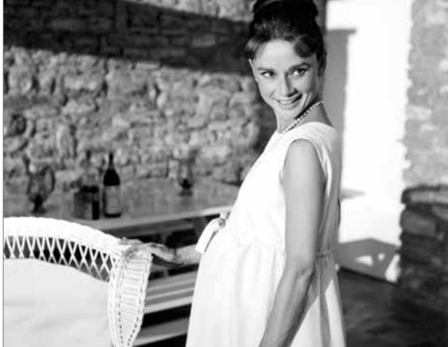
Strălucind de fericire — și cu mine