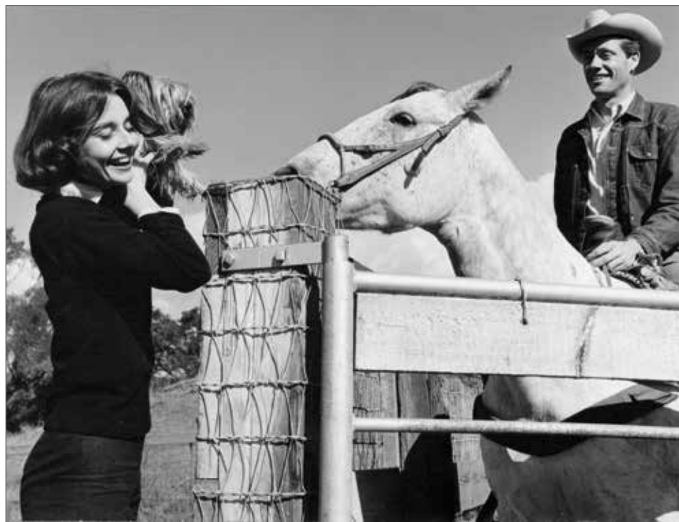
O mulțime de animale la ferma lui Gary Cooper din Santa Monica