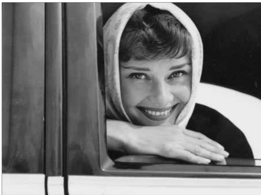
Fericită acasă, în Elveția (Mel Ferrer / arhiva familiei Hepburn)