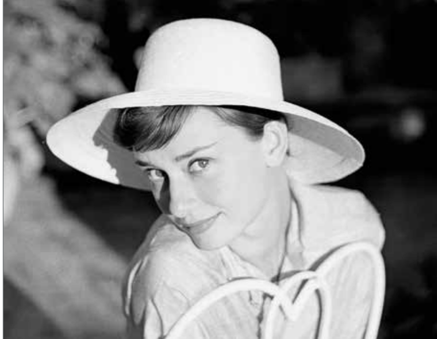
Tata a făcut această fotografie a frumoasei sale soții