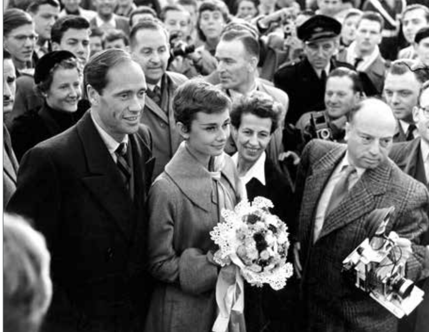
Sosind la o altă premieră, undeva în Europa