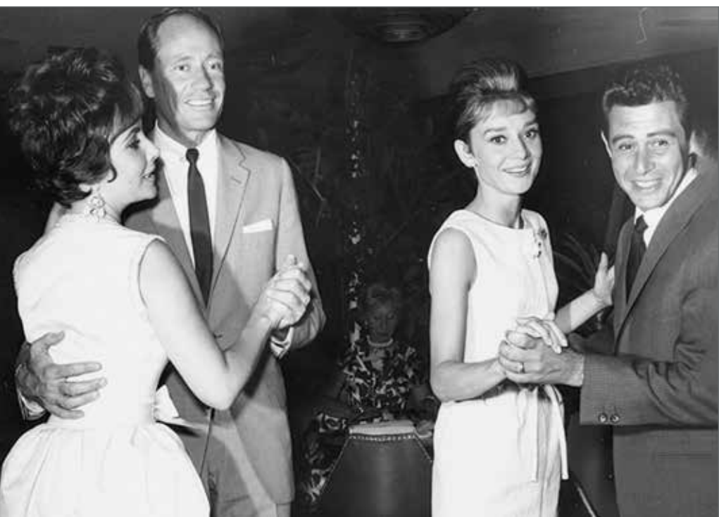
Dansând cu Eddie Fisher și Elizabeth Taylor